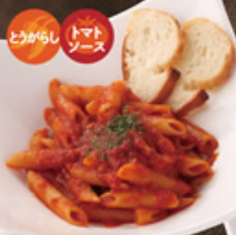
アラビアータ トマトソース ゴルゴンゾーラ 980円+税 1,100円+税