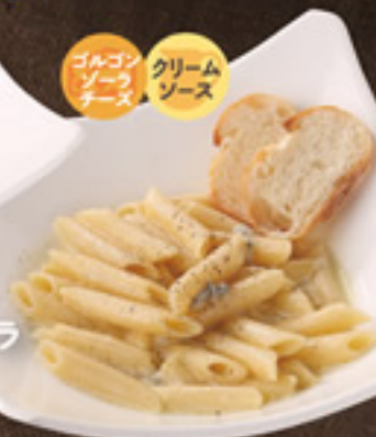
ゴルゴンゾーラソース クリームソース