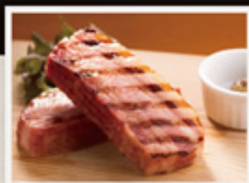
厚切りベーコン (2切れ)