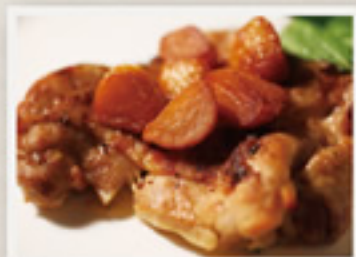
鶏のディアボロ (ガーリック焼き)