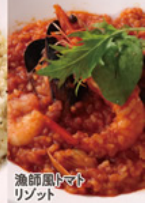
漁師風トマト リゾット 1,100円+税