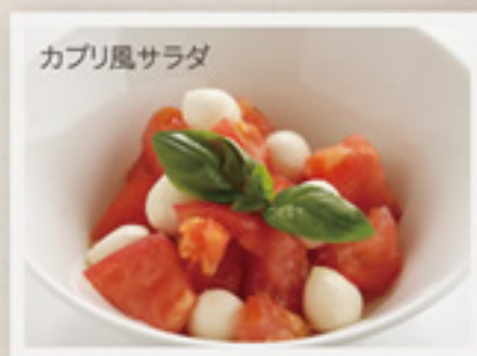
カプリ風サラダ トマトとモッツアレラのカプレーゼ ..... 680円+税