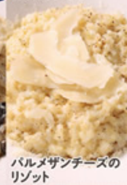
バルメザンチーズの リゾット 1,080円+税