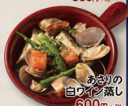
あさりの白ワイン蒸し