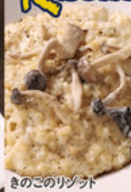
きのこのリゾット 980円+税