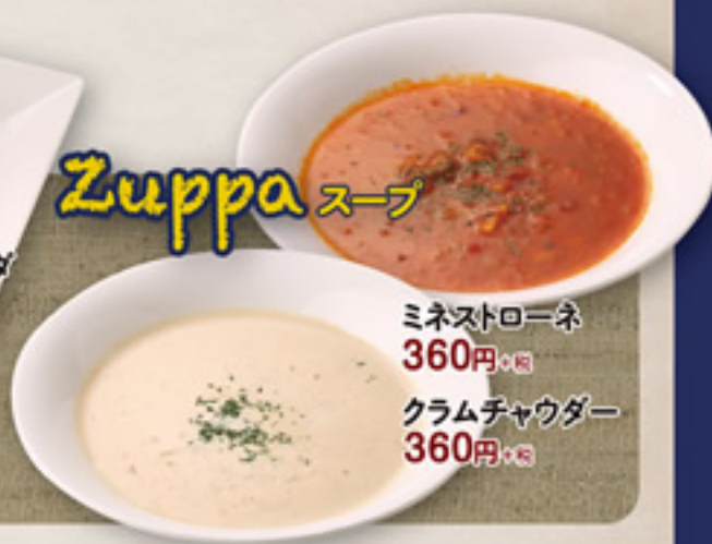
ミネストローネ 360円+税