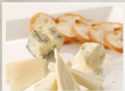
チーズの盛合せ ..... 800円+税