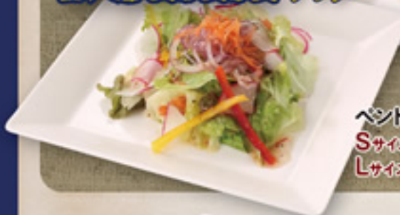
生ハムシーザーサラダ Sサイズ450円+税 Lサイズ750円+税