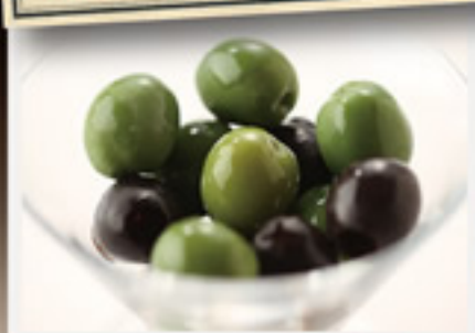
2種オリーブ ..... 350円+税