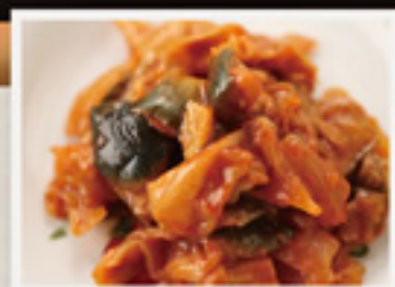
カボナータ (野菜のトマト煮)